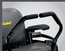
MANETTES CONFORT ACCOUDOIRS DE SIEGE