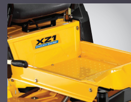
LARGE ESPACE POUR LES JAMBES